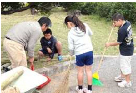
[ 教頭先生の手伝い：4年生 ]