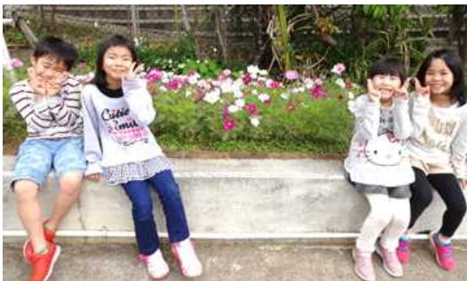
[正門横にコスモスが満開：1年生]