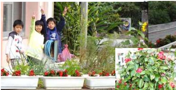
[ 花壇の水かけ：3年生 ]