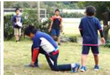
[ 丸庭でフリスビー：2年生 ]